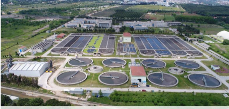
3- Gebze wastewater Treatment Plant 1 km away from the GTU Campus