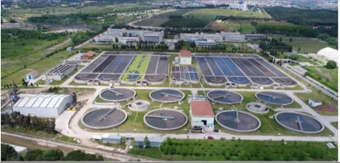
Gebze wastewater Treatment Plant 1 km away from the GTU Campus

Evrak Tarih ve Sayısı: 05.10.2023-E.122722